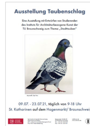
Plakat TU Braunschweig