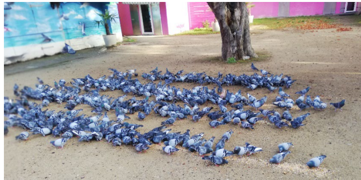
Futterstelle Bruchstraße Kontakthof

dazu, dass dortige mit dem Paramyxovirose-Virus infizierte Tiere nicht mit anderen Tauben in Kontakt kommen. Es war zu dieser Zeit zudem beabsichtigt, die circa 300 Stadttauben aus dem Haus Bruchstraße 18 vor dem Abriss zur schnelleren Umsiedlung in einen betreuten Taubenschlag, der hinter dem